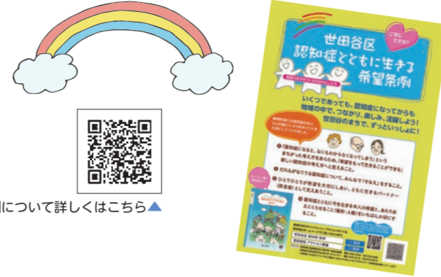
希望条例について詳しくはこちら▲

区では、認知症の本人を含む全ての区民が自分らしく生きる希望を持ち、本人の意思と権利が尊重され、安心して暮らし続けることのできる地域共生社会の実現をめざし、2年10月に「世田谷区認知症とともに生きる希望条例」を施行しました。