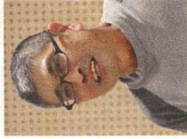
りょうちやん 6期生

脳ろうそくがカワイパー好きなものがわからなくなっても大丈夫です。舞えすぎないでゆきましよう。