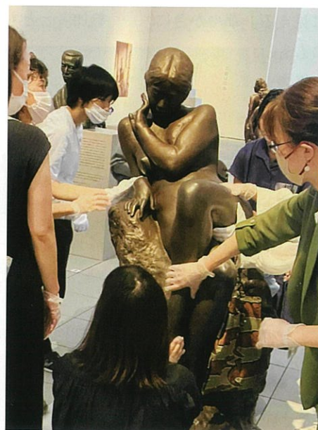
流れる：裸婦像を触察する