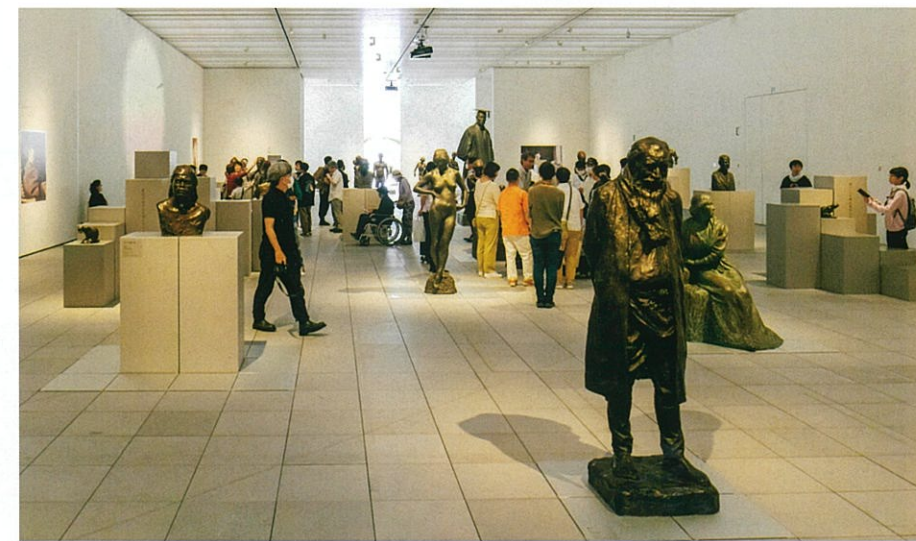
おおいた障がい者芸術文化支援センター主催「彫刻をさわる時間」の会場風景（大分県立美術館「朝倉文夫生誕140周年記念 猫と巡る140年、そして現在」展にて）

僕が「さわる＝目に見えない世界を探る」ためのキーワードとして重視するのが「入る」「流れる」「求める」の三つである。2023年7月に大分県立美術館、および遊歩公園で開かれた「彫刻をさわる時間」は、イベント参加者とともに、この三つのキーワードを確認する貴重